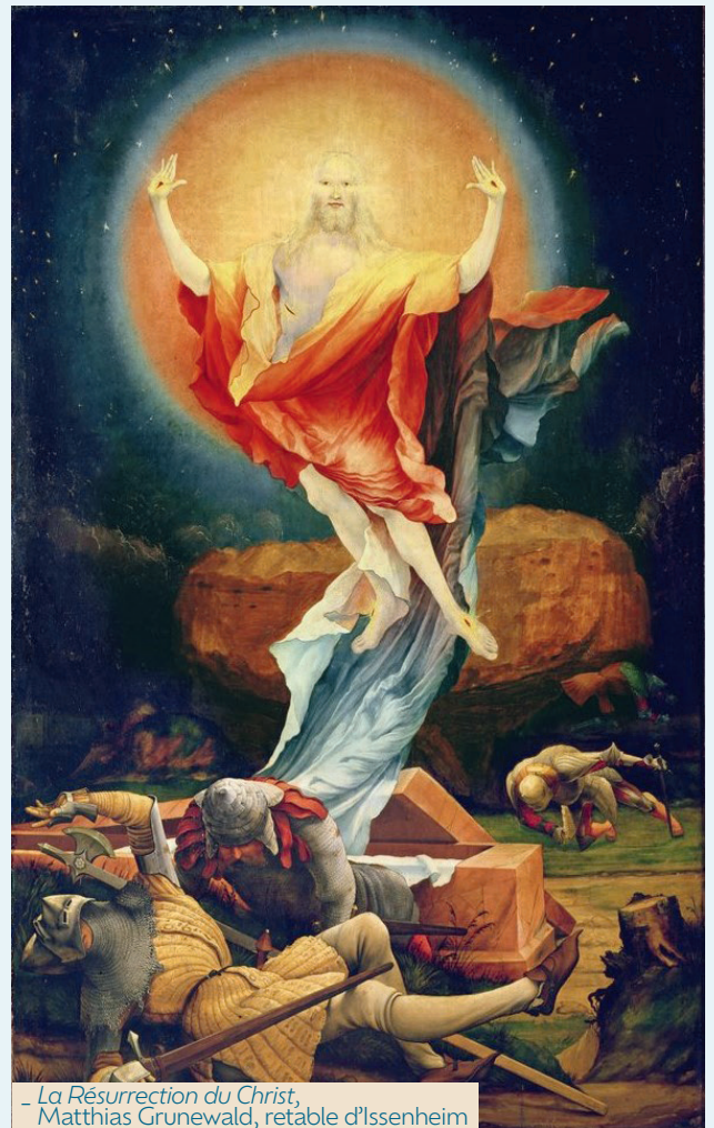
- La Résurrection du Christ, - Matthias Grunewald, retable d'Issenheim

Comme la question assourdissante de notre monde sans Dieu. Invité toutefois à renoncer à sa plainte lancinante. Pourquoi te désoler, ô mon âme, et gémir sur moi ? Espère en Dieu ! De nouveau je rendrai grâce : il est mon sauveur et mon Dieu.